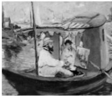
Monet et sa femme sur le bateau atelier Claude Monet, 1874

Une barque sur l'eau calme .... Le long de la rive quelques arbres au feuillage rafraichissant ... Camille rêve.