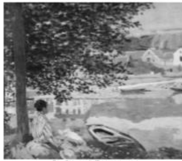
La Seine à Bernecourt Claude Monet, 1868