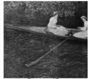
En canot sur l'Epte Claude Monet, 1887 ou 1890